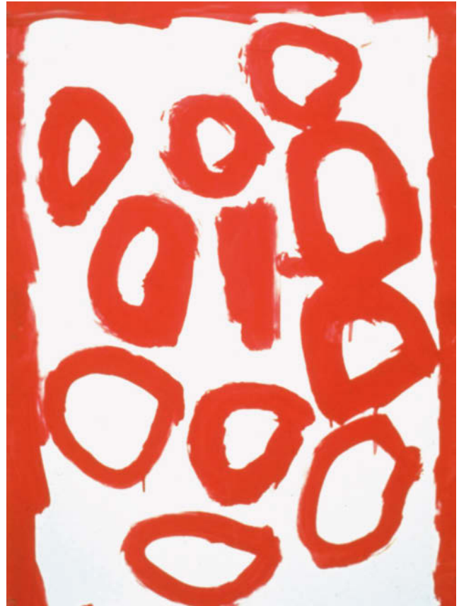
Irgendwann trifft die Richtung auf ihren Anfang, die Form wird geschlossen.