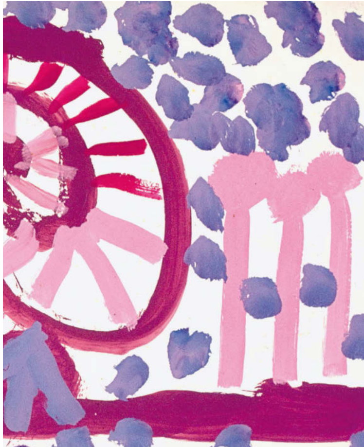
wird entdeckt, Absicht wird möglich.