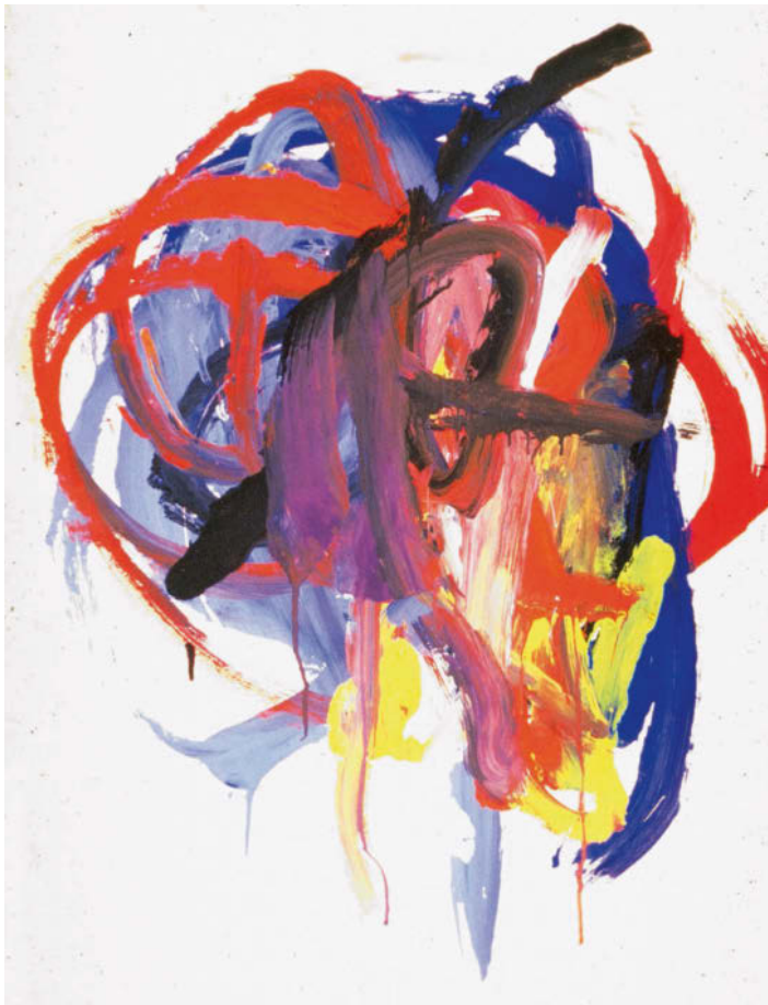
Die ersten Körperbilder werden rein motorisch kreisend gesteuert. Es entstehen Kritzelknäuel.